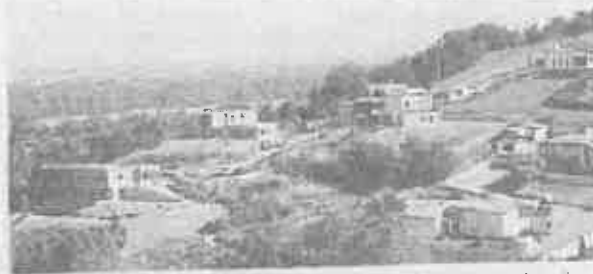
Des constructions modernes sur les hauteurs de Lacroix-Falgarde, en 2013, conformes au POS.

Dans le cadre de l'élaboration du Plan Local d'Urbanisme (PLU) de la commune de Lacroix-Falgarde, la municipalité invite les habitants à la première présentation publique du Projet d'Aménagement et de Développement Durables (PADD) le vendredi 24 février 2017 à 19 h 00 salle du Foyer Rural.