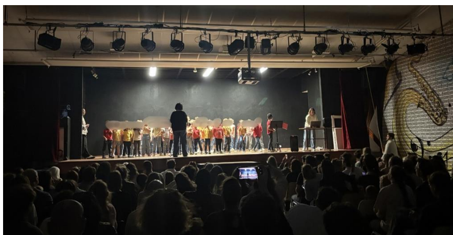
Chorale des élèves de GS, CP et CP-CE1 au Foyer Rural le 12 Mai.