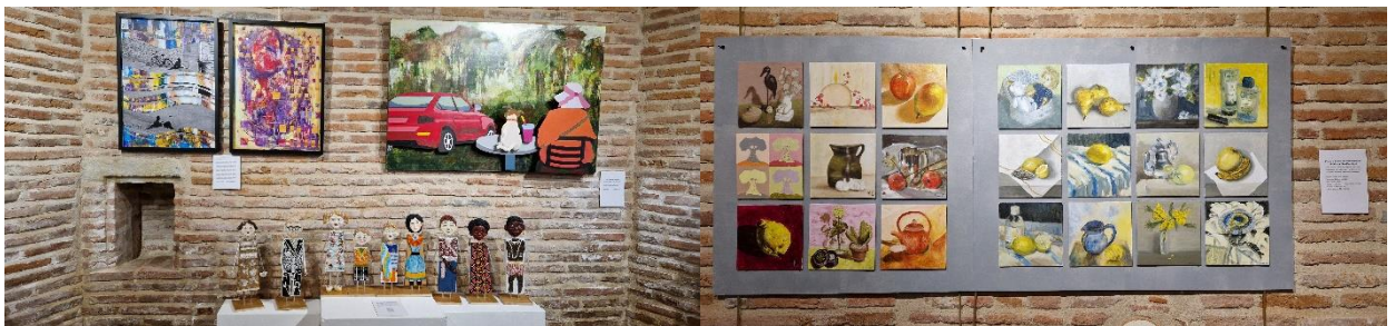
Les Amis de La Gleysette ont célébré le 25 ème anniversaire de l'association.