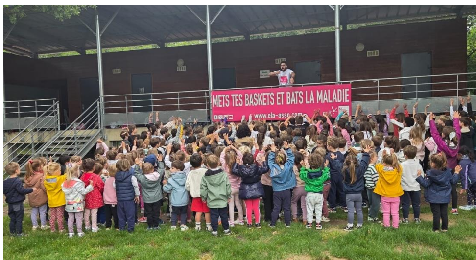
Les élèves des écoles maternelle et primaire ont participé à la course ELA le 18 Mai.