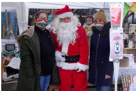
La Dépêche du Midi, G.B., le 15/12/21

Par la qualité de ses commerces, le centre commercial de Lacroix-Falgarde est une zone attractive pour les habitants du village et des alentours. Il est aussi un point central et un lieu de croisement de nombreuses routes des coteaux. Il est donc tentant de se donner rendez-vous pour faire du covoiturage ou d'y laisser sa voiture pour se promener. Cependant en laissant sa voiture pour une demi-journée ou plus, le parking se retrouve vite saturé en places de stationnement, surtout le week-end. La municipalité est consciente du problème et réfléchit à des solutions mais celles-ci ne seront pas mises en œuvre de suite. C'est pourquoi il est bon de rappeler qu'il existe une aire de covoiturage sur le parking juste à côté de l'église (en plein centre du village aussi) et que nos amis sportifs (cyclistes ou coureurs) peuvent utiliser le parking du groupe scolaire le Cossignol entièrement libre le week-end. Alors faites circuler l'information et n'hésitez pas à changer votre lieu de rendez-vous de quelques mètres !