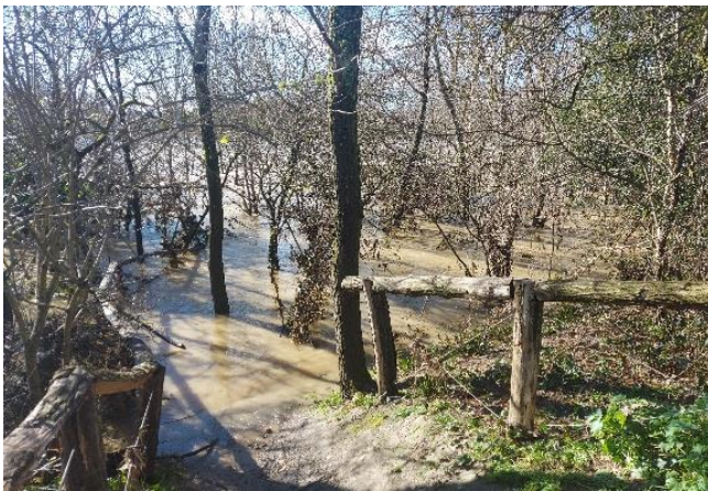
Accès au cheminement en bord d'Ariège, 10/01