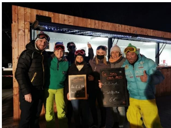
Soirée « Les Bronzés font du ski »