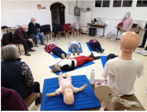
Formation Premiers secours pour les seniors organisée les 2 et 13 décembre 2021