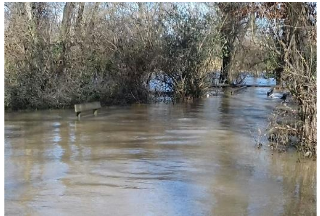
Ponton sur (sous) l'Ariège, 10/01