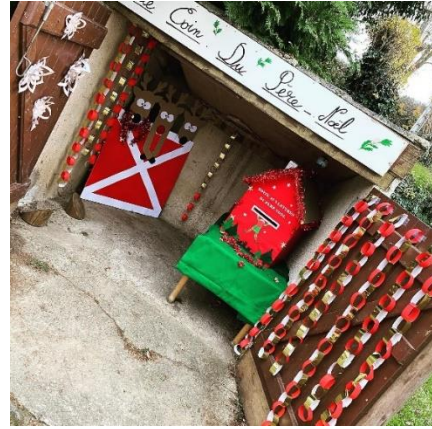
Le coin du père Noël du groupe scolaire

Ce début d'année a été marqué par de fortes inondations