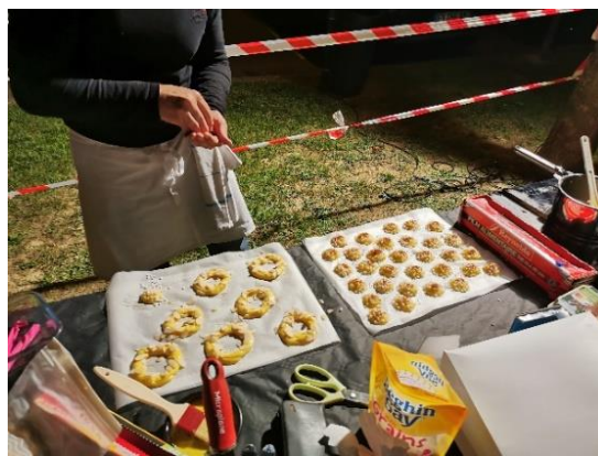
Soirée « Battle pâtisseries »