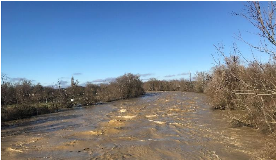
L'Ariège sort de son lit, 10/01

Ce début d'année a été marqué par de fortes inondations