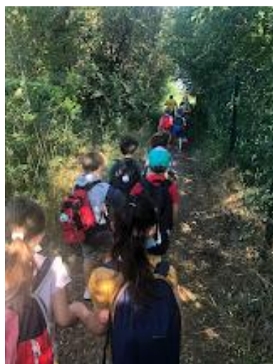
La sortie et la fête de l'école sur le ramier municipal