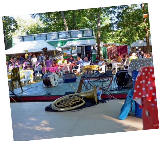
L'éphémère guinguette a fêté ses dix ans