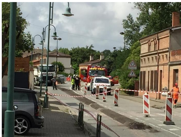
Les travaux cet été sur l'avenue des Pyrénées redevenue le temps d'une fuite de gaz une rue piétonne...