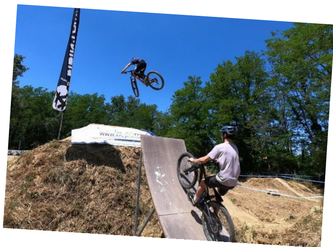
Retrouvez la vidéo de l'événement Ridin'Family au terrain de bosses le 13 juillet à Lacroix sur: https://www.youtube.com/watch?v=EISCjm6cAiA