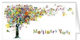
L'équipe du Foyer Rural

Nous vous réitérons nos bons vœux et pour ceux qui ont pris de bonnes résolutions en ce début d'année n'attendez plus : il reste des places dans les cours proposées par le foyer rural. N'hésitez pas à prendre contact avec le secrétariat au 05.61.76.27.57.