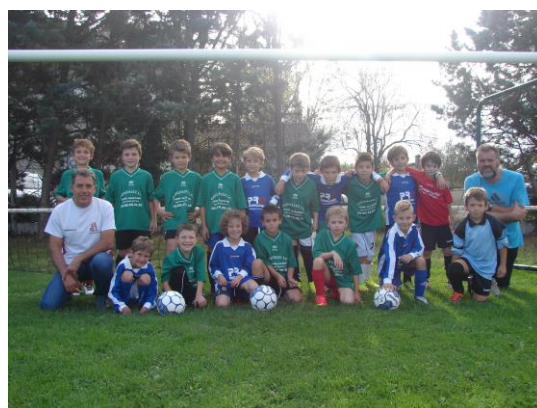
Photo de la catégorie U8-U9

Bravo aussi à l'équipe 1 sénior, qui à mi-parcours du championnat, est première de son classement.